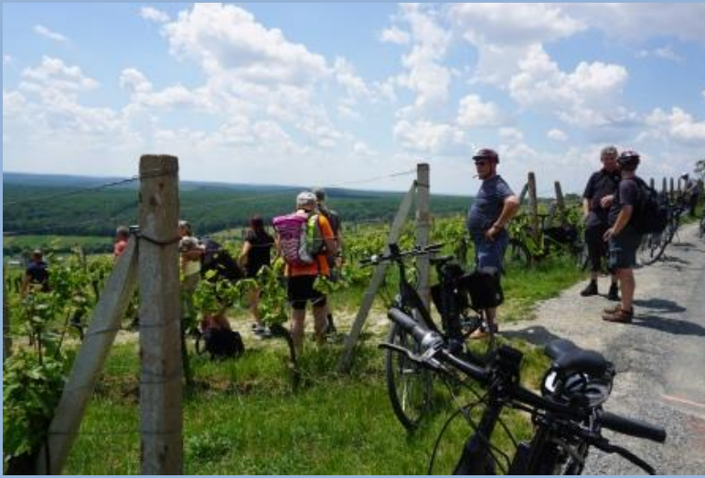
Abbildung 1: Projektaufakt: Transferbesuch im Südburgenland 2019